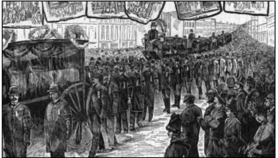
Επίκαιρη ξυλογραφία της κηδείας των τεσσάρων κρεμασμένων ανδρών

Στις 26 Ιουνίου 1893 ο κυβερνήτης Altgeld τους απελευθέρωσε. Ξεκαθάρισε ότι δεν έδωσε τη χάρη επειδή πίστευε ότι τα άτομα είχαν υποφέρει αρκετά, αλλά επειδή ήταν αθώα για το έγκλημα για το οποίο είχαν δικαστεί. Αυτοί και οι κρεμασμένοι ήταν τα