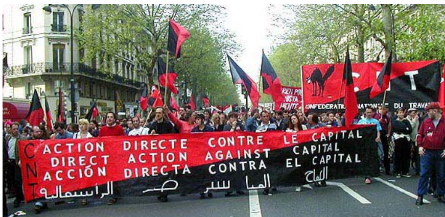
Παρίσι, Πρωτομαγιά 2000

Ο κοιμισμένος εργάτης, που απομιζείται από το βαμπίρ του καπιταλισμού, ετοιμάζεται να ξυπνήσει από την αγγελική φιγούρα του Σοσιαλισμού.