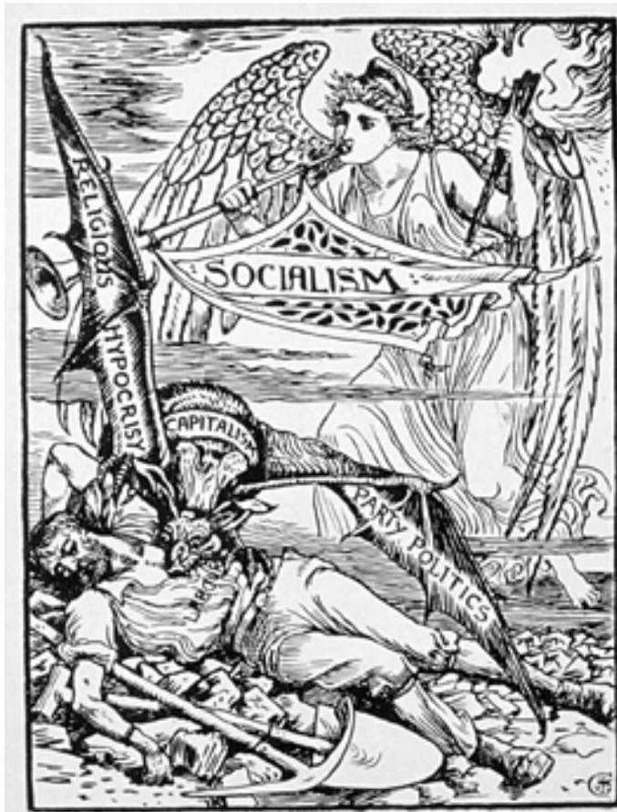
WALTER CRANE, "The Vampire", 1885.

Ο κοιμισμένος εργάτης, που απομιζείται από το βαμπίρ του καπιταλισμού, ετοιμάζεται να ξυπνήσει από την αγγελική φιγούρα του Σοσιαλισμού.