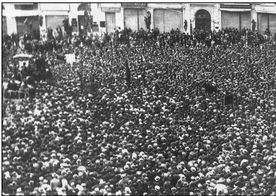
Κυριακή 10 Μάη. Ο λαός της Θεσσαλονίκης κηδεύει τα θύματα της εξέγερσης

Μετά τον πόλεμο φεύγει από την Ελλάδα ουσιαστικά σαν πρόσφυγας. Επιστρέφει στην δικτατορία και έκτοτε ζει στη Θεσσαλονίκη.